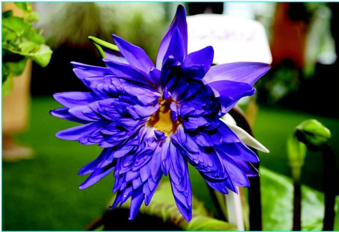
บัวควีนสิริกิติ์ พรรณไม้งามพระนามราชินีในรัชกาลที่ 9