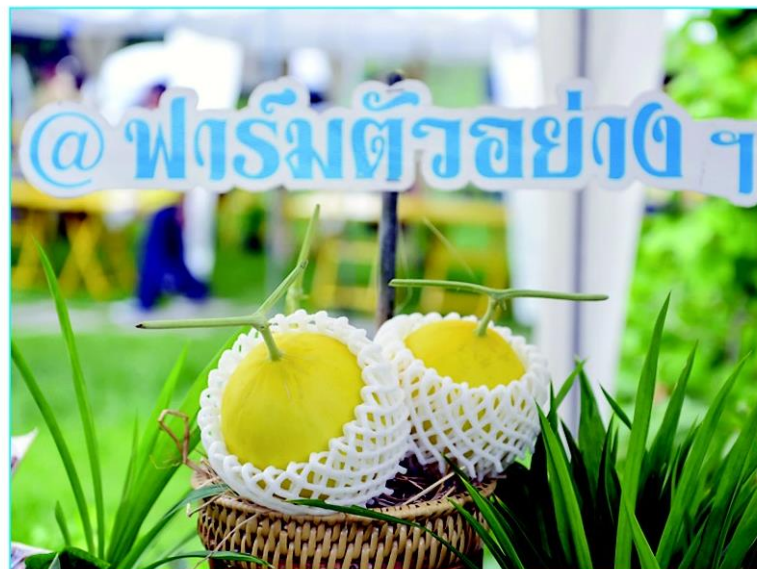
เรียนรู้ฟาร์มตัวอย่างที่เป็นต้นแบบต่อยอดพระราชปณิธาน