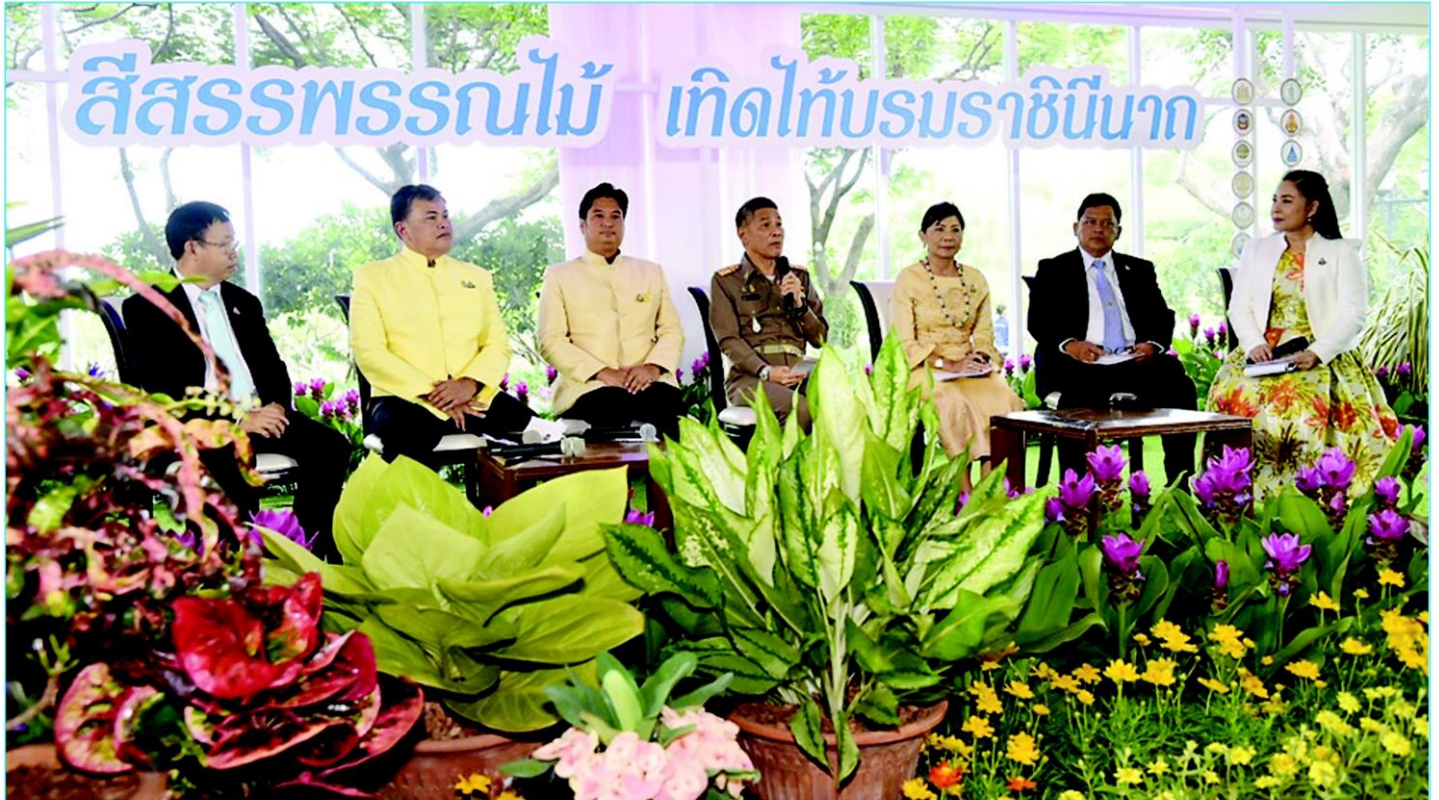
ชวนเที่ยวงาน "สิสรพรรณไม้ เกิดทับบรมราชินีนาถ" วันที่ 8-14 ส.ค.นี้