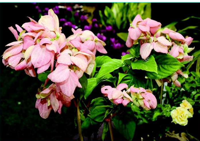
จัดแสดงพรรณไม้ ดอนญ่าควีนสิริกิติ์

ประดับนานาชนิด โดยเฉพาะปทุมมาหลากหลายพันธุ์ที่จะบานสะพรั่ง และยังมีดอกบานชื่น ดาวเรือง ดาวกระจาย สร้อยไก่ ฯลฯ รวมกว่าแสนต้น เพิ่มสีสัน สร้างความตระการตาแก่ผู้มาเที่ยวชมแล้ว ยังมีพรรณการในถ้ำ “พรรณไม้ในวรรณคดีไทยในเขตกรุงเทพมหานคร” ด้วยตระหนักคุณค่าวรรณคดี