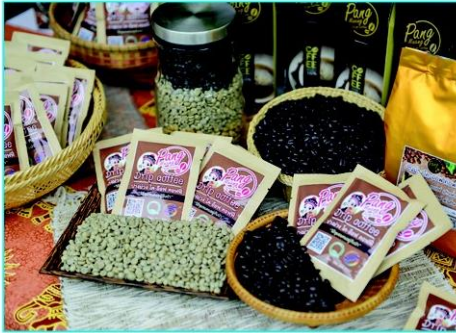
กาแพปางม่วง โค-ฮ็อฟ คอฟฟี่ สินค้าขึ้นชื่อชาวมุเซอ จ.เชียงราย

เขียนา โกลน หน้าวัวใบ และลั่นมั่งกร สนับสนุนเกษตรกรพัฒนาพรรณไม้ให้สวยงามด้วย